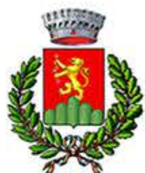
Comune di Monteleone di Spoleto