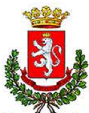
Comune di Norcia